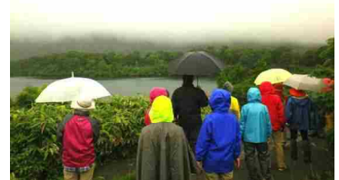
須川湖周辺の自然を観察