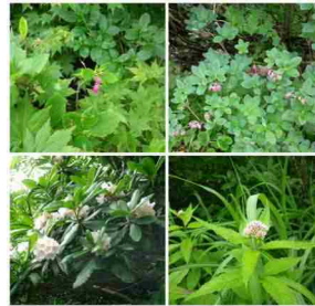
高山植物の花々を観察