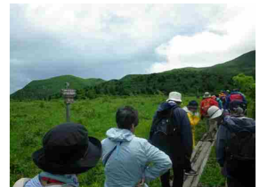
名残ヶ原周辺を散策