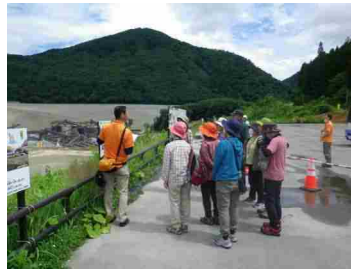
成瀬ダムの工事現場を見学

参加者の皆様からは、「ガイドさんの説明でさまざまな高山植物の名前を知ることができてよかった。」「今度は、栗駒山の紅葉を見に訪れたい。」などの感想をいただきました。